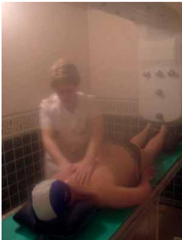
Ducha de Vichy