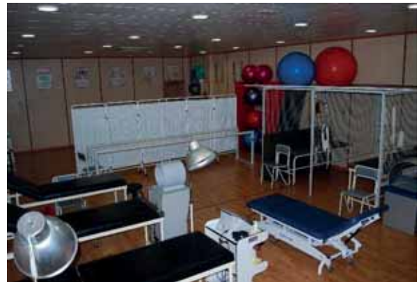
Zona de Cinesiterapia y Mecanoterapia