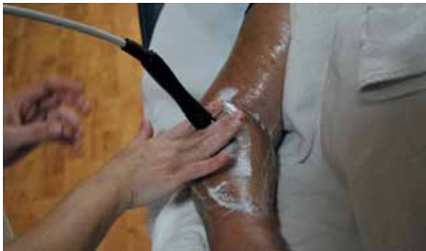
Tratamiento de radiofrecuencia