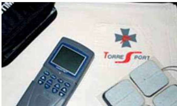
Equipo para tratamiento a domicilio