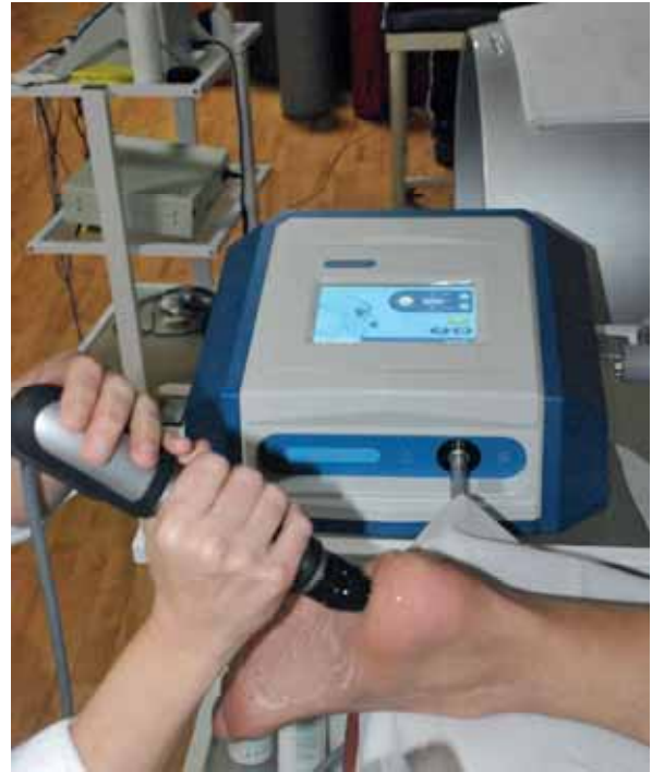
Tratamiento con Ondas de Choque