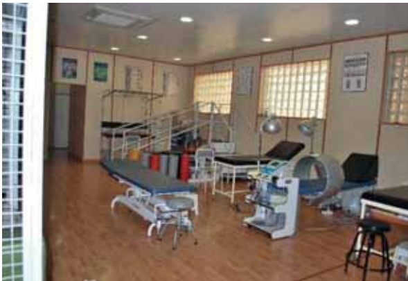
Zona de Cinesiterapia y Mecanoterapia