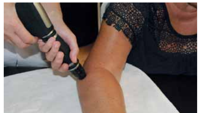
Tratamiento con Ondas de Choque