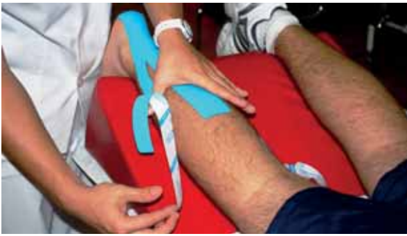
Tratamiento con Kinesio-Tape