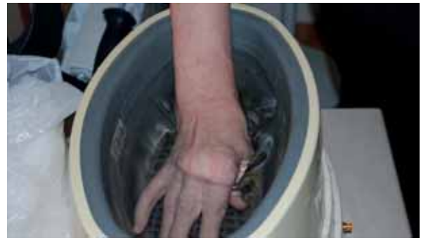
Tratamiento con parafina