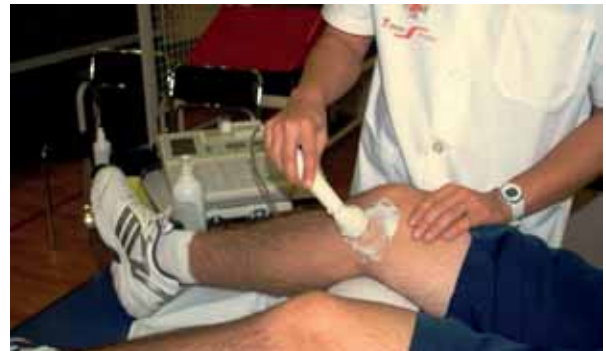
Tratamiento con ultrasonidos