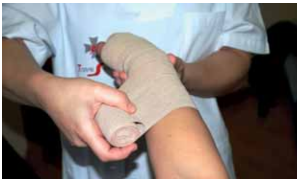
Drenaje Linfático Manual