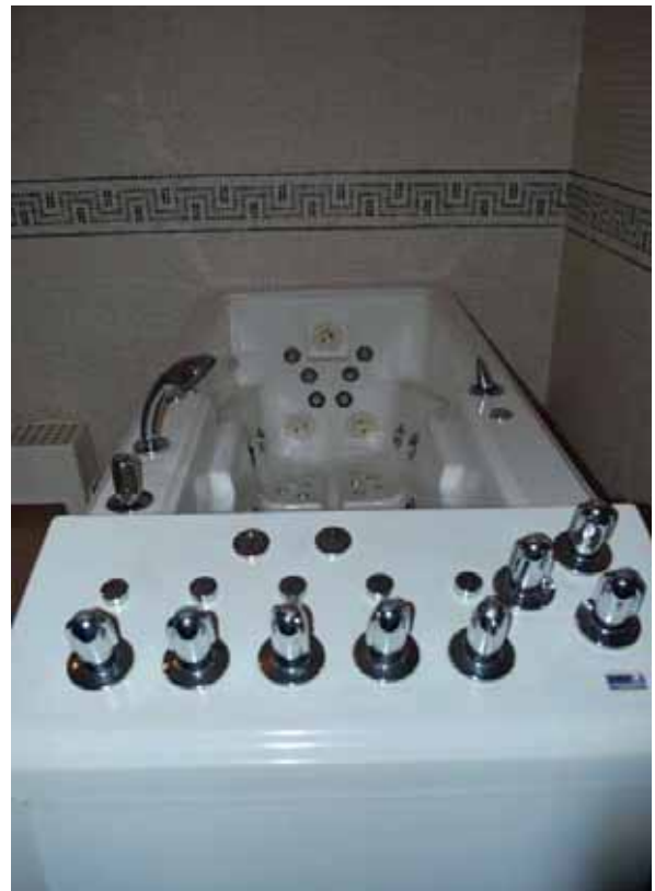
Bañera de Hidromasaje