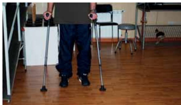
Recuperación de procesos neurológico