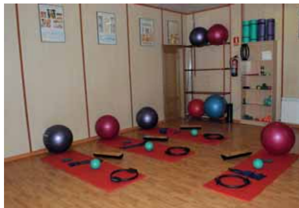
Zona de Pilates