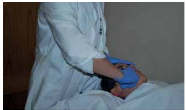
Tratamiento de ATM